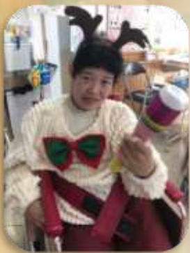
沢山の拍手 ありがとうございます！