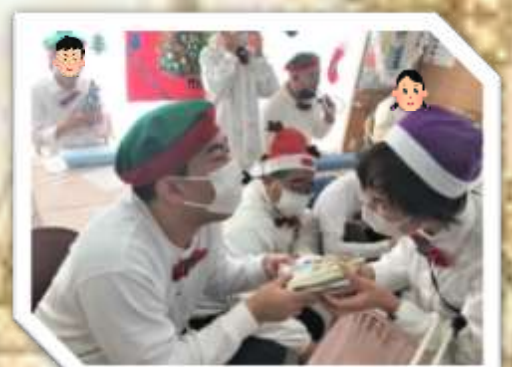
今年のクリスマス会も 楽しみにしていま〜す(笑)