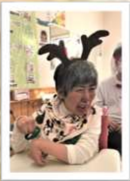
みんなにっこり笑顔です