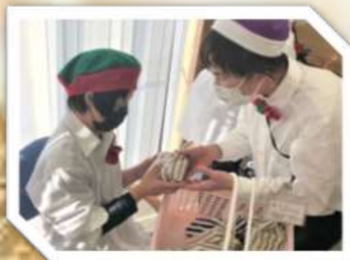
みんなにプレゼント ありがとうございます♥