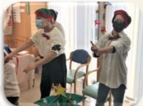
毎日の練習の成果が 出てよかったです