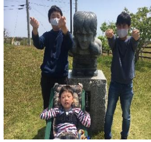
飯岡灯台・鹿島神宮