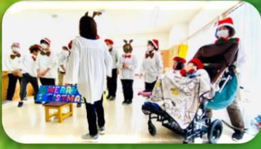
みんなクリスマスバージョンの衣装だよ