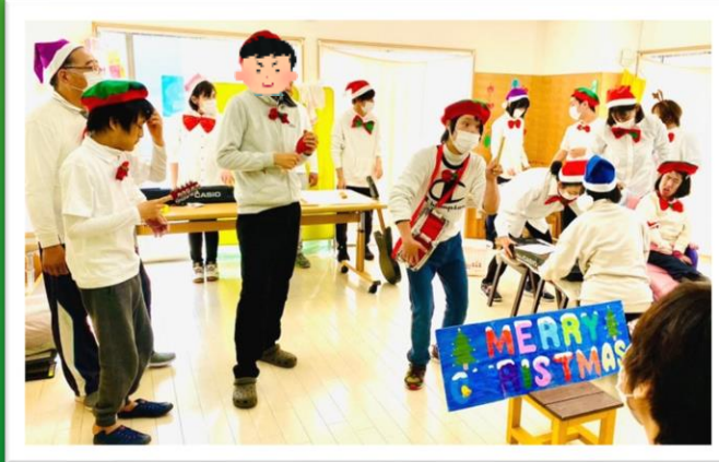
沢山の拍手をいただきました！